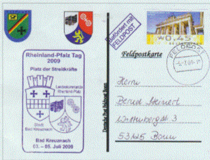
Bild-Feldpostkarte der Deutschen Post Feldpost Bonn zum Rheinland-Pfalz-Tag mit sauber abgeschlagenem Tagesstempel und zwei Cachetstempeln.

Das Jahr 2009 hielt für die Philatelisten der Bundeswehr-Feldpost wieder die eine oder andere Überraschung bereit – in positiver und leider auch in negativer Hinsicht – wie im Teil I in philatelie 391/Januar 2010 dargestellt. Die Feldpost hatte offenbar in ihren süddeutschen Sonderfeldpostämtern (SoFpÄ) das Postgeheimnis neu entdeckt und dabei etliche Sammler verprellt. Mit diesem Beitrag wird der Jahresrückblick 2009 fortgesetzt und schon eine Vorschau auf mögliche Sonderfeldpostämter (SoFpÄ) in diesem Jahr gewagt.