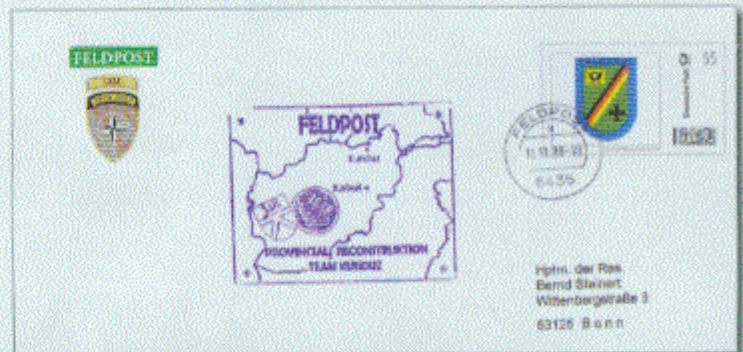
Neuer amtlicher Feldpost Plusbrief für das ISAF-Kontingent in Afghanistan vom Feldpostamt in Kunduz mit seltenem Stempel 6435a vom 11.11.2009.

len Eingreiftruppe“, die nur über diese Nummer erreichbar seien; dem Kompaniefeldwebel der jeweiligen Einheit ist der Empfänger wiederum unter dieser Nummer bekannt, so dass die Post den Soldaten auf diesem Wege zuverlässig erreicht.