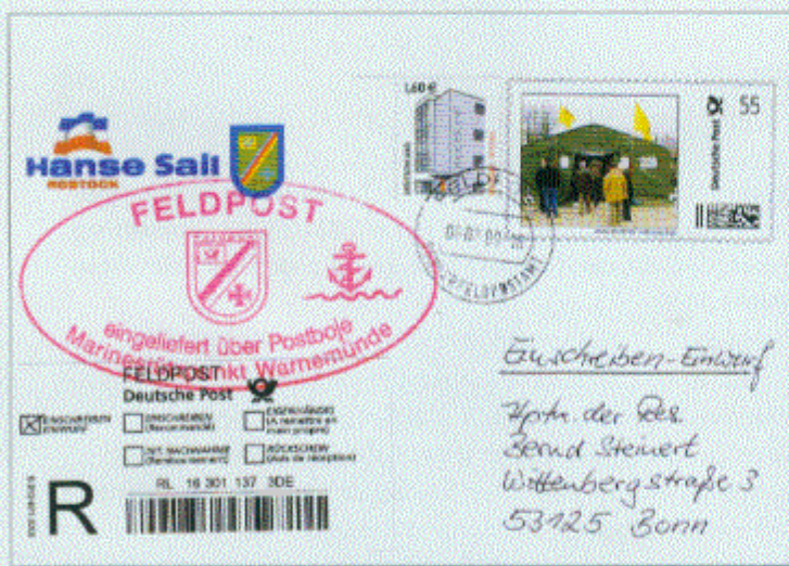
Privater Plusbrief Individuell mit neuem Feldpost-Tagesstempel vom 6.8.2009 als Einschreiben über die Postboje als Bojen-Feldpost gelaufen (!)

Am zweiten Tag der Veranstaltung kam es durch einen technischen Defekt am eingesetzten Hammerstempel zu einer fehlerhaften Wiedergabe der eingestellten Jahres- und Uhrzeit. Diese sichtbar fehlerhaften Stempeldaten wurden von den Feldpostlern handschriftlich gestrichen. Neben dem fehlerhaften Stempelabdruck wurden mittels eines Fauststempels die korrekten Einlieferungsdaten abgeschlagen. Die Empfänger dieser doppelt gestempelten Belege wurden von der Feldpost hierüber unterrichtet und mit einer postalischen „Kleinigkeit“ entschädigt.