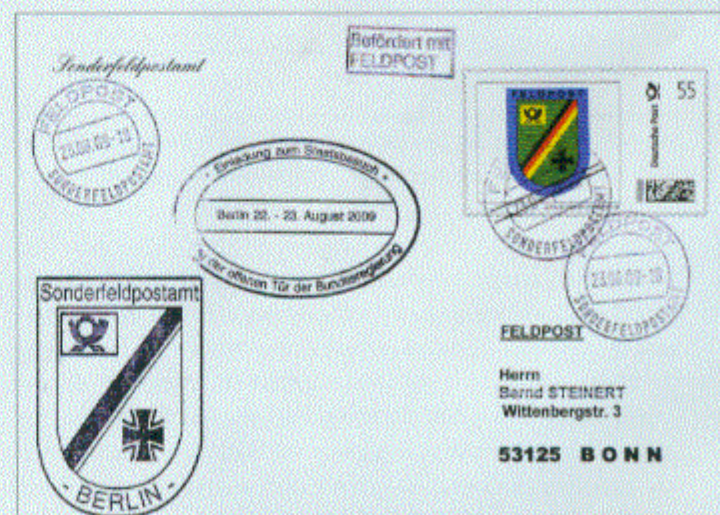
Stempelkorrektur auf amtlichem Feldpost-Plusbrief Individuell mit zwei zusätzlichen Nachstempelungen vom 23.8.2009 und drei Cachets vom „Tag der offenen Tür der Bundesregierung“.