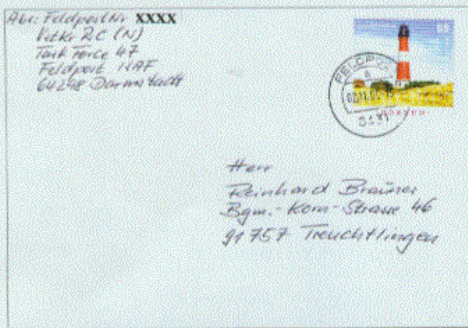
Feldpostbrief eines Einsatzsoldaten mit „verdeckter“ Feldpostnummer in der Absenderangabe, gelaufen über das FpA in Mazar-e-Sharif am 2.11.2009 (zum Schutz des Absenders wurde die Fp-Nummer in der Abbildung durch XXXX ersetzt).

Zwar hatte sich auch der Landesverband Rheinland-Pfalz um ein SoFpA für seine Veranstaltung zum Reservistentag 2009 in Bad Dürkheim bemüht, war vom SKUKdo in Köln jedoch abschlägig beschieden worden, da der Landesverband in den letzten drei Jahren bereits seine Veranstaltungen in Bitburg, Wissen/Sieg und Mainz mit SoFpA durchgeführt hatte. Dies hielt den Landesverband in Mainz aber nicht davon ab, für die vorgesehene Veranstaltung am 3. Oktober – auch ohne SoFpA – einen attraktiven Plusbrief individuell aufzulegen und den Besuchern anzubieten.